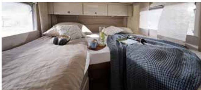
T 569 Nexxo Van

Als Einsteigermodell für bis zu 2 Personen, besonders wendig und kompakt.